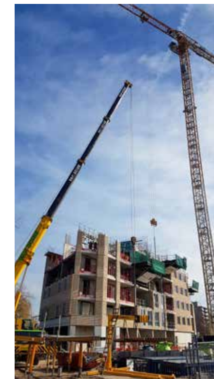
Bouwwerkzaamheden Bij de Zijl.