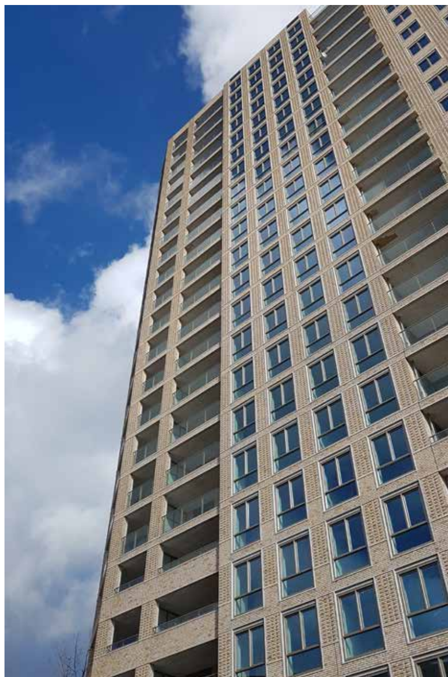
De 70 meter hoge woontoren.

Op de voormalige locatie van het ROC in Leiderdorp ligt de gloednieuwe wijk Bij de Zijl: een levendig, gevarieerd woongebied met 182 woningen en appartementen rondom een groen plantsoen. Het nieuwbouwproject is in zeer korte tijd gerealiseerd. Dat is te danken aan de innovatieve bouwwijze, maar ook aan de goede sfeer en verbinding op de werkvloer.